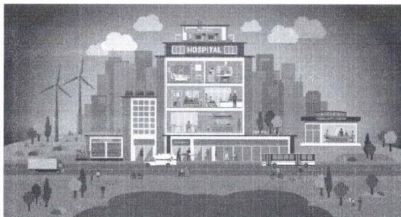
กลุ่มงานอนามัยสิ่งแวดล้อมและอาชีวอนามัย สำนักงานสาธารณสุขจังหวัดตราด